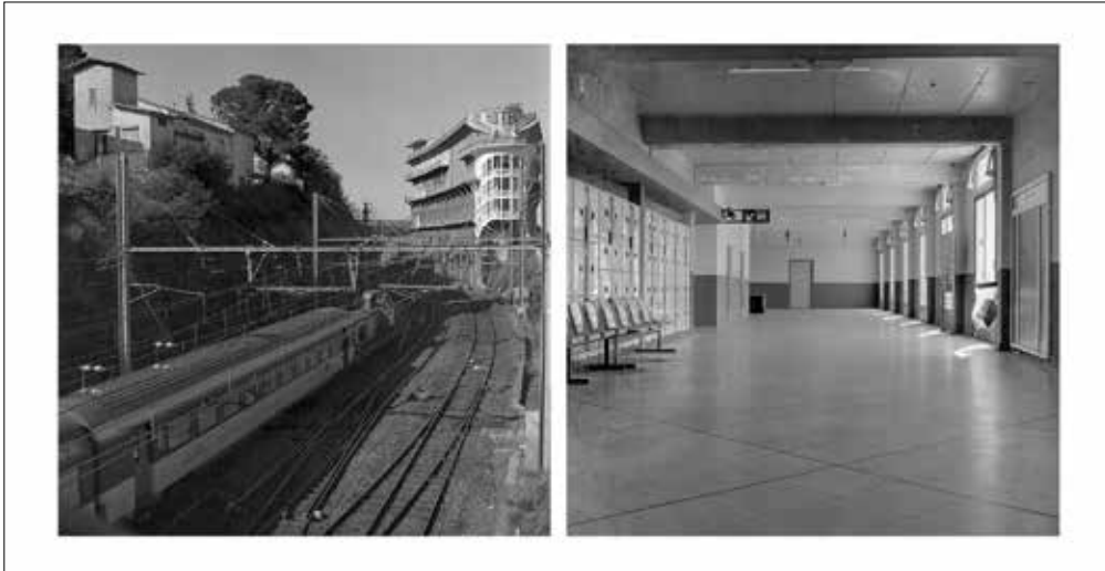
Blue velvet - Bobby Vinton

Les séries des autres prix pour les thèmes « passages » et « fiction » sont projetées sur grand écran le jour du vernissage, dans la salle du cinéma du Belvédère.